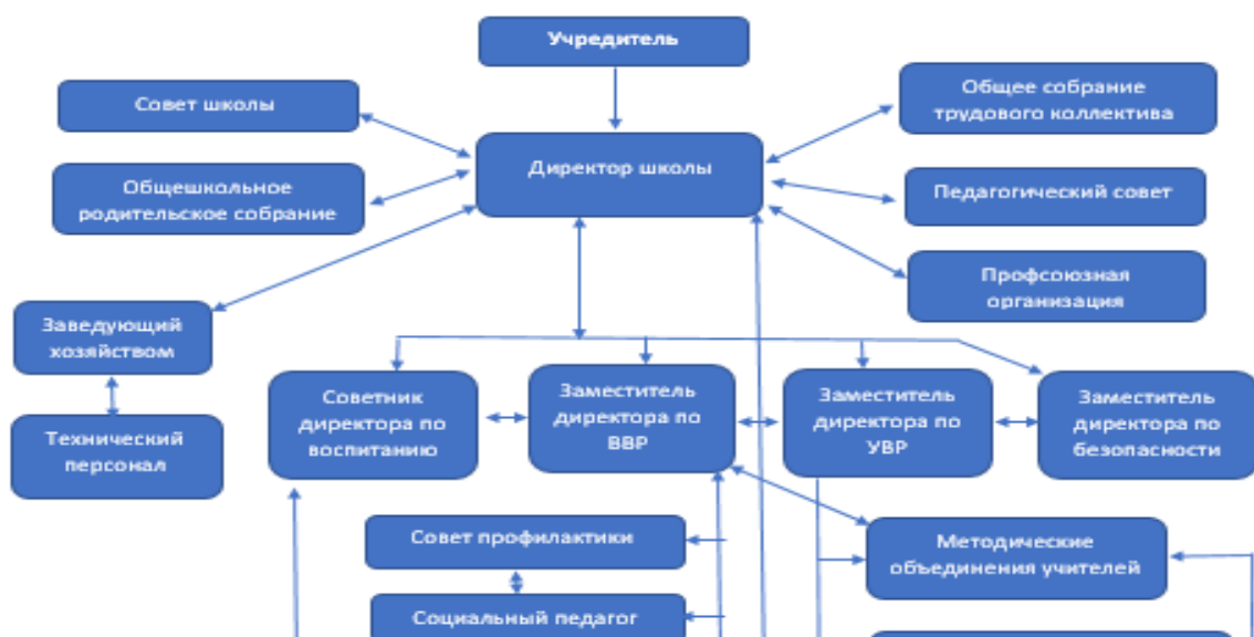
Схема взаимодействия работников Школы.

Подробные полномочия и процедура формирования органов описаны в уставе Школы.